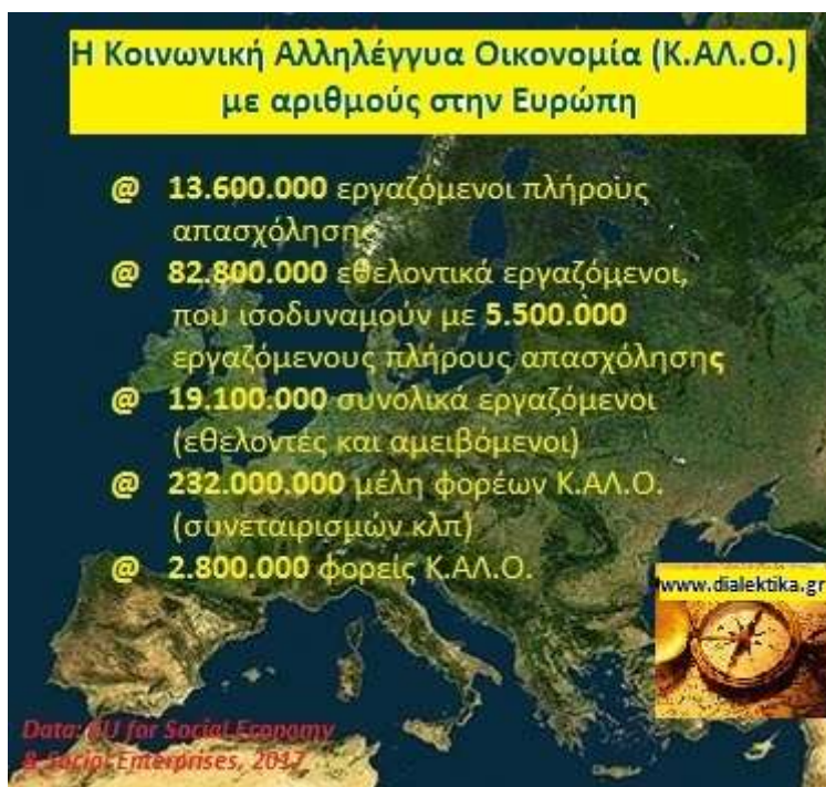
Η Κοινωνική Αλληλέγγυα Οικονομία στην Ευρώπη

Η γενική εικόνα ποικίλλει μεταξύ των χωρών της ΕΕ. Ενώ η απασχόληση στην κοινωνική οικονομία αντιπροσωπεύει μεταξύ 9% και 10% του ενεργού πληθυσμού σε χώρες όπως το Βέλγιο, η Ιταλία, το Λουξεμβούργο, η Γαλλία και οι Κάτω Χώρες, στα νέα κράτη μέλη της ΕΕ